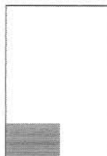
1/8 eme de Page